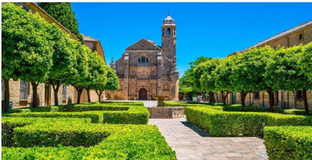
Ubeda (Jaén). Declarada Patrimonio Mundial por la UNESCO en 2003