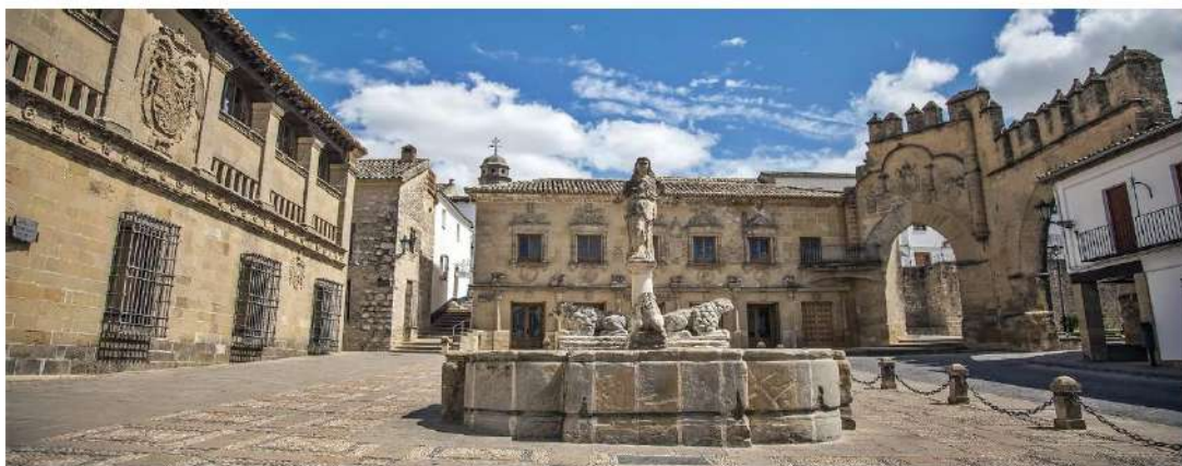
Baeza (Jaén) Declarada Patrimonio Mundial por la UNESCO en 2003

También podrán contratarse en la Secretaría oficial en el congreso de la Asociación Centro Internacional para la Conservación del Patrimonio (CICOP.España) quedando sujetas a disponibilidad de plazas